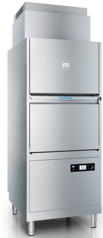
Topf- und Utensilien- spülmaschinen